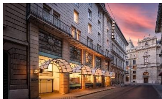
Budapest, Révay u. 24. 1065 Hungría

16.15h- Check in en K+K Hotel Opera Budapest (o similar). Un buen hotel y sobre todo estratégicamente magníficamente situado para múltiples visitas. Incluimos el desayuno dentro del precio final. Las rooms serán dobles con dos camas para poder alojar desde individuales, a dobles, triples, cuádruples. Si viajas "solo" no es obligatorio coger una habitación individual.