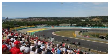
Visión desde nuestras localidades

ENTRADA F1 INCLUIDA EN PRECIO PARA LAS 3 JORNADAS. SECCIÓN TURN 1 (Curva 1 final de recta de Salida/Llegada)