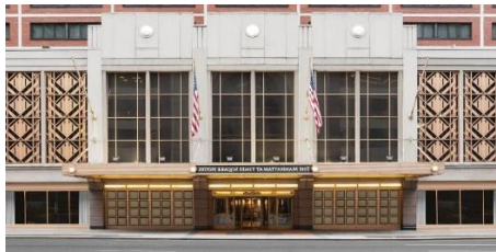
790 7th Avenue, Nueva York, NY 10019

21.45h- Check in en The Manhattan at Times Square Hotel . Un buen alojamiento y sobre todo estratégicamente magníficamente situado para múltiples visitas.